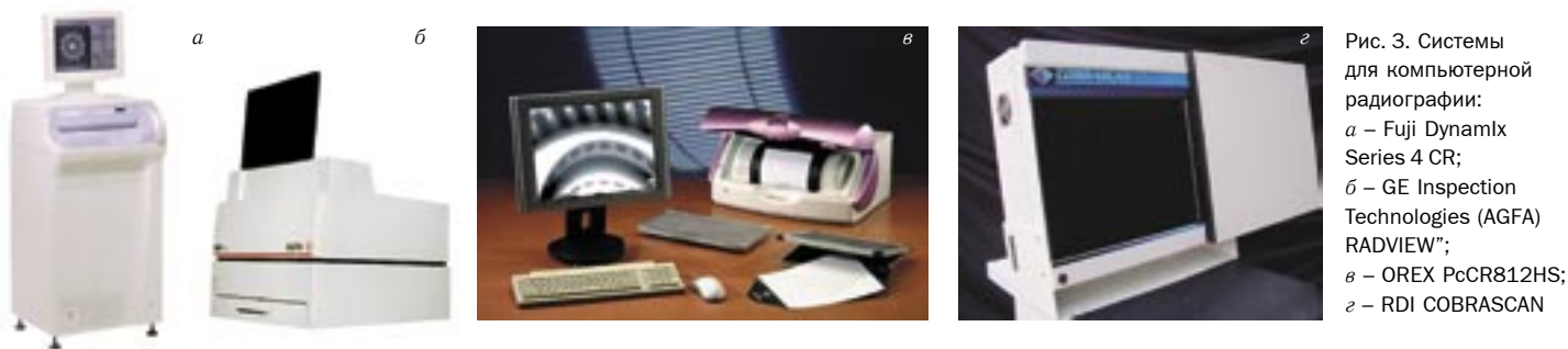
Рис. 3. Системы для компьютерной радиографии: а – Fuji Dynamix Series 4 CR; б – GE Inspection Technologies (AGFA) RADVIEW™; в – OREX PcCR812HS; з – RDI COBRASCAN

ле с использованием программ поиска дефектов, делается заключение и производится распечатка протокола контроля.